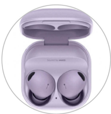
갤럭시 버즈 프로2