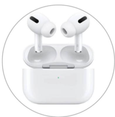
AirPods Pro 2세대

※ 행사 당일 행운권 추첨을 통해 푸짐한 경품을 준비했으니 많은 관심과 참여 부탁드립니다.