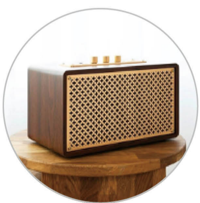
브리츠 블루투스 스피커