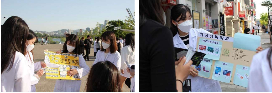
2022 Medical Awareness Campaign(MAC)

KNAPS는 매년 한강시민공원에서 의약품 바로알기 캠페인(Medical Awareness Campaign, MAC)을 진행하고 있습니다. 100여 명의 약대생과 젊은 약사들이 시민들에게 의약품 및 보건 의료에 관한 잘못된 상식을 바로잡아주고 올바른 정보를 전달하고 있습니다. 또한 시민들이 평상시에 가지고 있던 의약품에 대한 의문점에 대해 질의응답을 하는 과정을 통하여 공중 보건을 향상시키고 약사에 대한 인식을 개선하고 있습니다.