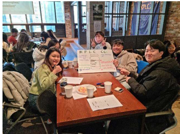
2023 K-Pharm Leaders' Camp

KNAPS에서는 NC와 함께, 국제 교류 리더십 프로그램(K-Pharm Leaders' Camp, KPLC)도 진행하고 있습니다. 올해 7회를 맞이하는 KPLC는 KNAPS의 대표적인 국제 교류 프로그램 중 하나로, 한국을 방문하는 전 세계의 약대생들과 함께 리더십을 주제로 강연을 듣고 서로의 문화를 이해하는 프로그램입니다. 이를 통해 글로벌 리더로서 약사의 직능을 계발하고 있으며, 국제적인 교류도 함께 하고 있습니다.