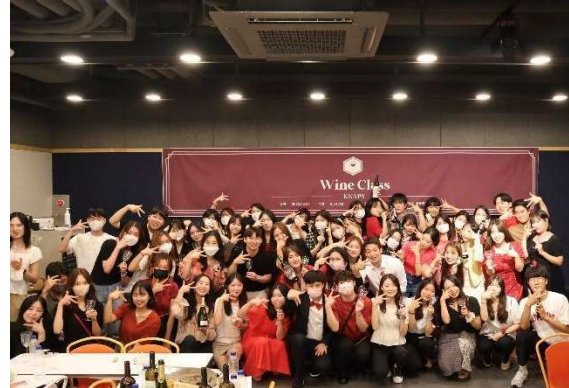
2022 Wine Class

위와 같은 대내외적인 활동을 통해 본 단체는 내부적으로는 학생들의 국민의 보건을 책임지는 약사로서의 직능 계발을 통한 국민 건강 증진을 도모하고 있으며, 나아가 외부적으로는 세계 보건에 이바지하는 글로벌 약사를 지향하는 단체로 자리 잡게 되었습니다. KNAPS는 앞으로도 다양한 활동들을 통해 국민건강보건증진 및 글로벌 약사로의 도약이라는 목적을 가지고 활동을 이어 나가고자 노력할 것입니다.