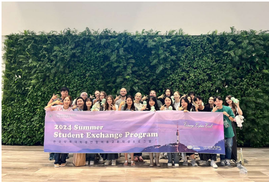
2024 Summer SEP Incoming, Republic of Korea

프로그램으로, 그동안 방문한 기관으로는 식품의약품안전처, 국립과학수사연구원, 국제백신연구소, 서울대병원, 한독제약, 종근당, 대한약사회, 아모레퍼시픽 등이 있습니다.