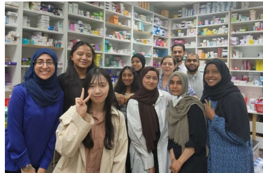
2023 Summer SEP Outgoing, the United Kingdom