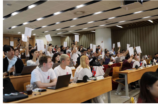
2024 World Congress in Incheon, Republic of Korea

또한, 본 단체는 아시아 태평양지역에 속해 있는 각국의 학생들이 모여서 상호간의 문화/정보 교류를 하는 국제 심포지엄인 APPS(Asia Pacific Pharmaceutical Symposium)에 참여합니다. 이 심포지엄은 매년 여름에 IPSF의 아시아/태평양지역 Regional Office인 IPSF-APRO에서 개최하는데, 1주일 간 차기 임원 선출과 주요 의제 표결 등을 시행하며 아시아 태평양지역에 속한 국가 간의 문화 교류에도 힘쓰고 있습니다. KNAPS는 2010년 서울대학교에서, 2016년 일산 동국대학교에서 APPS를 주최한 바 있으며 APRO의 중심에서 활동하고 있습니다.