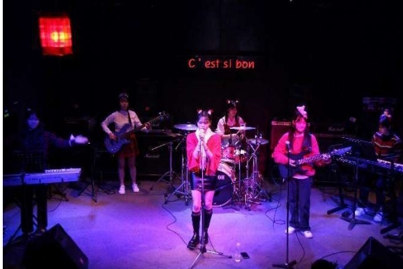
2022 Christmas Party

KNAPS는 국내 약대생들의 Networking을 위한 인프라도 구축하고 있습니다. 매년 12월에 진행되는 크리스마스 파티는 다양한 공연과 이벤트들이 준비되어 있어, 전국 약대생들이 함께 만나 즐길 수 있는 연말 파티입니다. 또한, 스노우보드캠프 및 와인클래스와 같이 공동의 취미를 배우고 공유하여 문화인으로서 약사가 되기 위한 자리 역시 제공하고 있습니다.