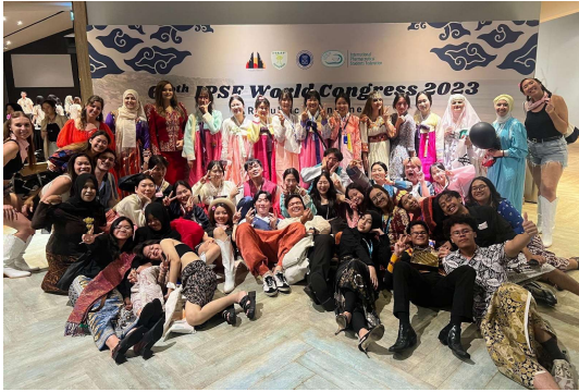
2023 World Congress in Bali, Indonesia