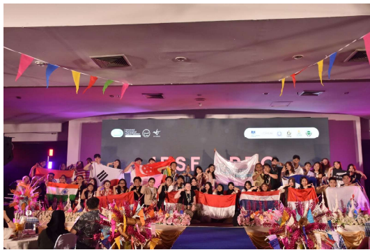
2024 APPS in Chiang Mai, Thailand

또한, 본 단체는 아시아 태평양지역에 속해 있는 각국의 학생들이 모여서 상호간의 문화/정보 교류를 하는 국제 심포지엄인 APPS(Asia Pacific Pharmaceutical Symposium)에 참여합니다. 이 심포지엄은 매년 여름에 IPSF의 아시아/태평양지역 Regional Office인 IPSF-APRO에서 개최하는데, 1주일 간 차기 임원 선출과 주요 의제 표결 등을 시행하며 아시아 태평양지역에 속한 국가 간의 문화 교류에도 힘쓰고 있습니다. KNAPS는 2010년 서울대학교에서, 2016년 일산 동국대학교에서 APPS를 주최한 바 있으며 APRO의 중심에서 활동하고 있습니다.