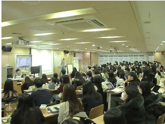
2023 National Congress

2023년에는 'PHACT: For Sustainable Pharmaceutical Act'라는 주제로 기후변화에 맞추어 약사가 지속가능한 의료생태계를 위해 할 수 있는 활동들에 대해 이야기하는 시간을 가졌습니다. 본 행사에서는 세미나 이외에도 약사 직능 계발을 위한 Session 인 복약상담대회(Patient Counseling Event, PCE), 약학퀴즈대회(Clinical Skills Event, CSE), 공중보건캠페인도 함께 진행되었습니다. 2023년 제11회 NC에 대한 더 많은 정보는 다음 게시글을 통해 확인할 수 있습니다. ( https://knaps.or.kr/420 )