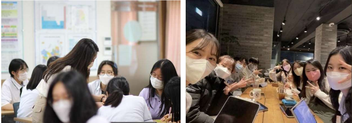
2022 Pharmacy Profession Awareness Campaign(PPAC)

한편, KNAPS는 대중들에게 약사의 직능을 알리고자 하는 목적으로 약사 직능 인식 캠페인(Pharmacy Profession Awareness Campaign, PPAC)을 실시하고 있습니다. 고등학생들을 대상으로 개편된 약학대학 진학 제도와 약사의 역할 및 직능에 대한 소개로 진행됩니다.