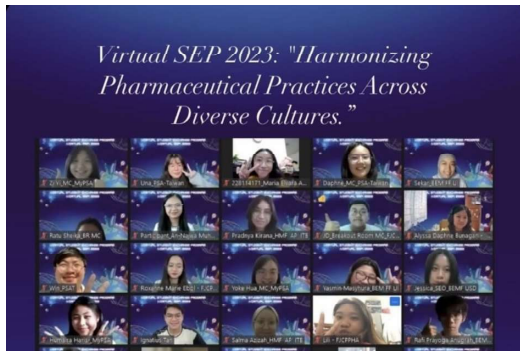
Virtual SEP with 아시아 8개국

또한, 국제협력국에서는 주최한 “Phampal: Language Exchange Programme”은 해외 약학대학생 연합과 협업하여 외국 약대생들과 교류하면서 서로의 언어와 문화를 교환하는 프로그램입니다. 2024년에는 독일 약학대학생 연합 BPhD, 대만 약학대학생 연합 PSA-Taiwan과 협업했습니다.